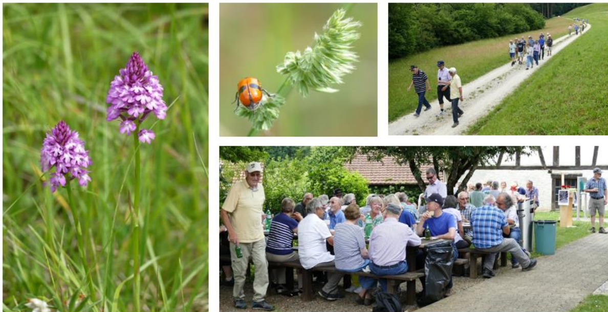
Abbildung 3 - Eindrücke von der Orchideenwanderung

Am 03.06.2018 führte der Verein eine Orchideenwanderung als seinen ersten Anlass durch.