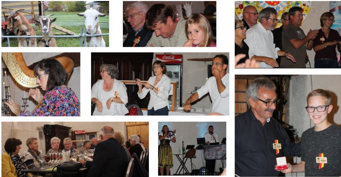
Abbildung 4 - Eindrücke von der Chilbi 2018

Beim anschliessenden Chilbi-Helferfest am 17.11.2018 konnten alle, die dabei gewesen waren, einen gemütlichen Abend mit einem feinen Essen aus der Schloss-Küche geniessen.