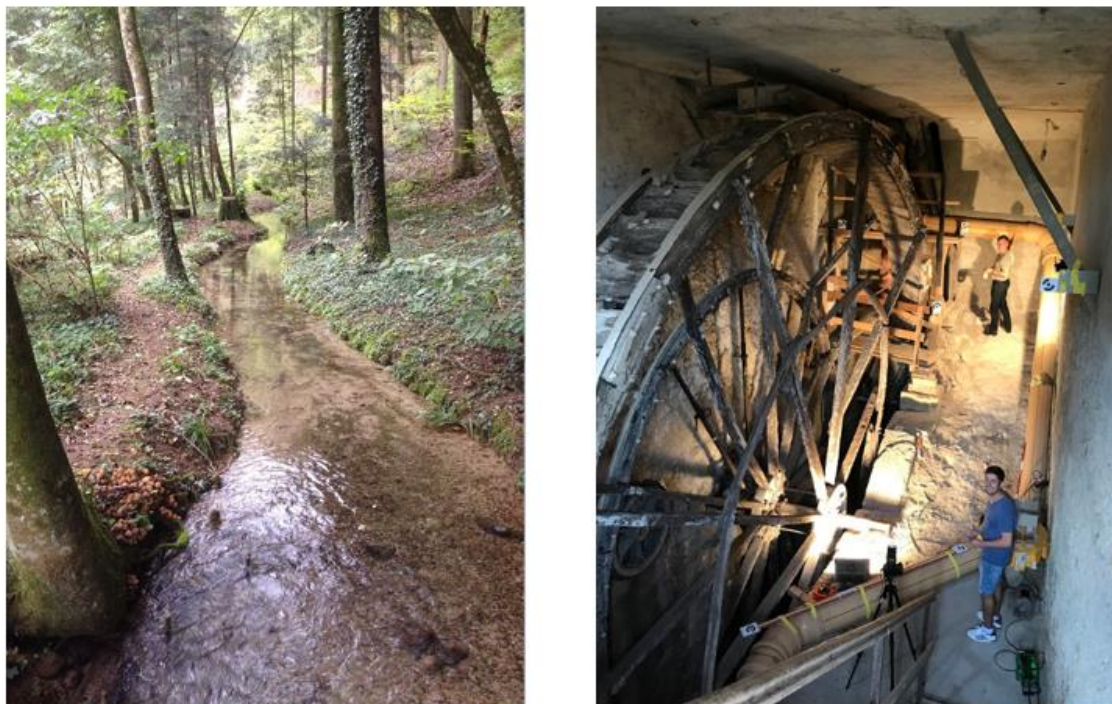
Abbildung 5 - Mühlebach und grosses Wasserrad

Nebst all diesen Geschehnissen und Arbeiten engagierte sich der Vorstand auch für die Kernpunkte des Vereins. Es sind dies: